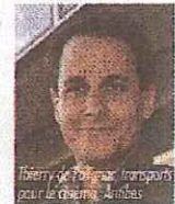
Thierry de P... pour le cinéma, Ambas