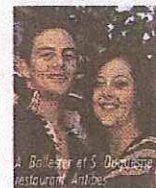
A. Bole... et S. Dou... restaurant, Ambas